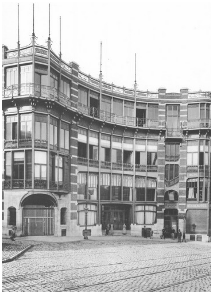
Ernst Wasmuth, plaat uit "Neubauten in Brüssel", 1899.

PROJECTIES IN HET HORTAMUSEUM VANAF 19 DECEMBER 2019