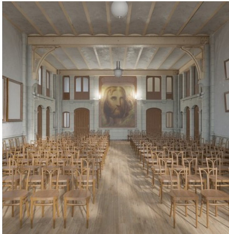
Laboratoire Alice, zicht op de Matteotizaal (draft), 2019.

Architect en professor aan de architectuurfaculteit van La Cambre-Horta (ULB) Onderzoeker verbonden aan het Laboratoire Alice van de Architectuurfaculteit La Cambre-Horta (ULB).